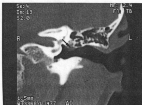
Fig. 2. Coronal CT scan shows the soft tissue mass (arrow) in the middle ear.