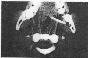
Fig. 2. C-T scanning showed a foreign body in the left parapharyngeal space which exposed into oropharynx.

방사선 소견 : 경부 컴퓨터 단층 촬영상 약 3.5cm 크기의 이물질이 내측은 설근 편도부와 외측으로는 좌측 하악각부의 하면을 경계로 놓여 있는 소견이 보였다(그림 2).