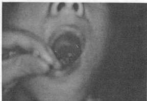
Fig. 1. The oropharynx showed protruding foreign body and granulation tissue on the left tonsillar fossa.

국소소견 : 우측 전경부에 길이 약 3cm 정도의 과거에 이물을 제거하였던 반흔이 있었고, 구강내에는 좌측편도와 하방에 비교적 평활한 모양의 유리조각이 구강내로 돌출되어 있었으며 주위 점막에 육아 조직의 형성을 볼 수 있었다(그림 1). 경부를 통해서도 이물질이 촉진되지는 않았다. 그의 구강및 경부에 특이 소견은 없었다.