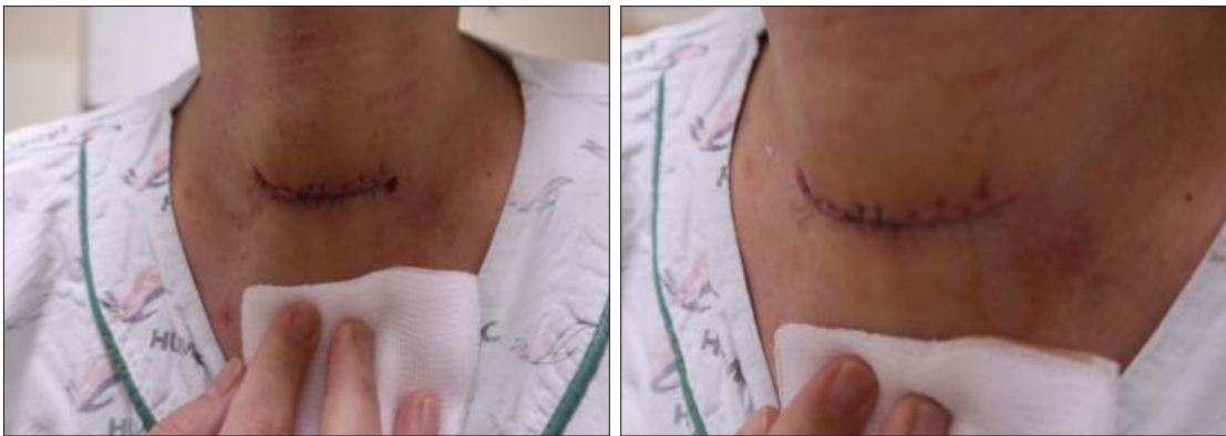
Fig. 5. Postoperative state of patients after surgery.

기 위해 타액의 흡인 예방을 위한 빈번한 suction 및 약물의 사용, 위식도 역류의 예방, 호흡기 감염의 적절한 처치 등이 도움이 된다고 하였다. 24) Tom 등과 Merritt 등은 육아종에 의해 치명적 기도폐색이 초래될 가능성을 지적하면서 주기적인 기관내시경 검사를 시행하여 육아종을 제거하고 다른 기관내 병변을 확인하는 것이 필요하다고 보고하였다. 25,26)