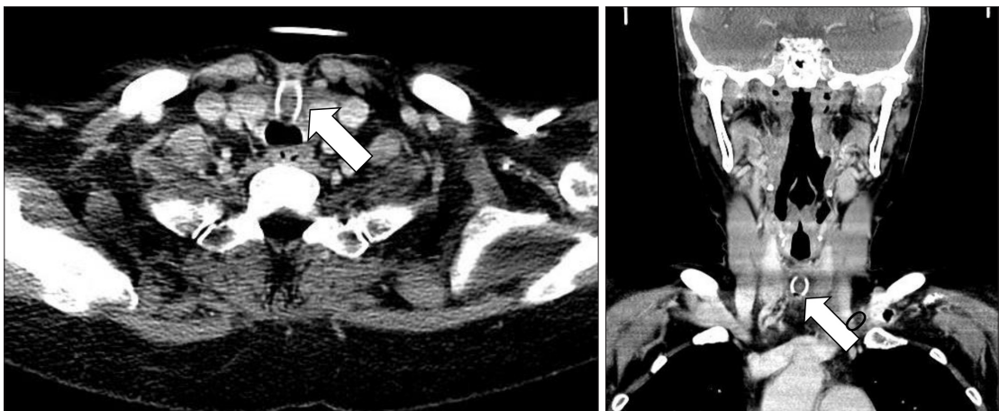
Fig. 1. Preoperative CT axial & coronal views (white arrow indicates granulation tissue inside the tube).

기관절개술의 합병증 발생은 술 후 1주일을 기준으로 초기합병증과 후기 합병증으로 구분하였는데, 이는 합