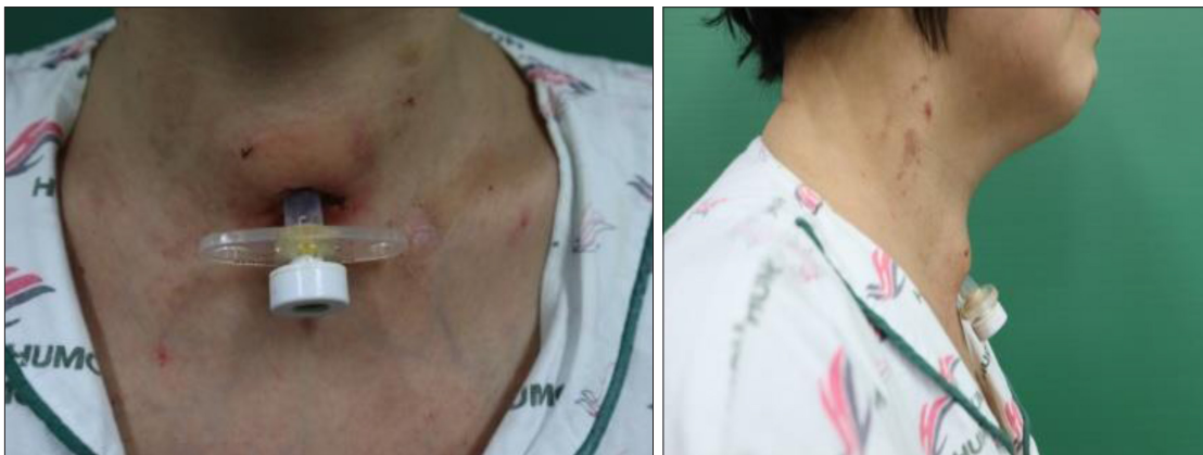
Fig. 3. Pre-op(fixed tube state with granulation).

병증의 양상이 이 시점의 전후로 다르기 때문이고, 다른 연구에서도 공통적으로 사용되는 기준이다. 15,16,17)