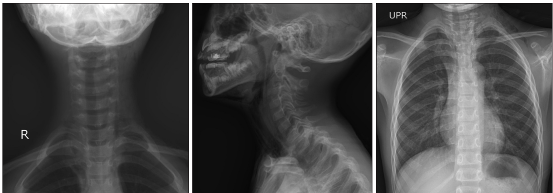
Fig. 2. Neck AP/Lat and Chest PA. Subcutaneous emphysema was observed in the neck and chest.