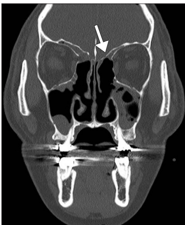
Fig. 2. Coronal OMU CT scan does not show definite focus of CSF leakage. Also, it shows more lowering of skull base (arrow) in left side than right side.

기뇌증으로 인해 나타날 수 있는 가장 흔한 증상은 두통인데, 그 양상이 매우 다양해서 임상 증상만으로 진단하기는 힘들며, 컴퓨터 전산화 단층촬영을 통해서 진단할 수 있다. 그리고 기뇌증이 발생한 경우 반드시 중환자실에 입원하여 신경학적 변화 양상이나 뇌수막염으로의 진행여부를 잘 관찰하여야 하고 신경외과와 협진을 하여야 한다. 공기가 자연히 흡수되는 경우가 대부분이므로 특별한 치료가 필요하지 않으나, 공기의 양이 계속 증가하거나