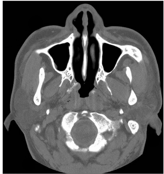
Fig. 2. Preoperative axial CT scan showing non-enhanced, poorly-circumscribed masses with irregular calcification at both Eustachian tubes.